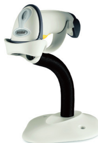
インテリスタンド(別売)