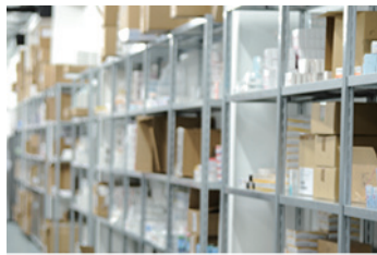
バックヤード業務