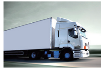
トレーサビリティ