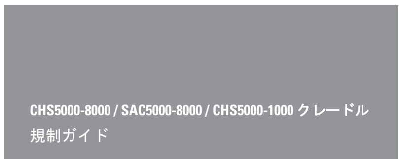
Zebra Technologies Corporation