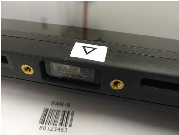
二次元バーコードエンジン