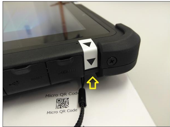
右上背面にバーコード用トリガボタンを配置