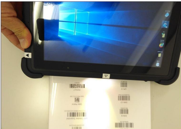
バーコード読み取り例